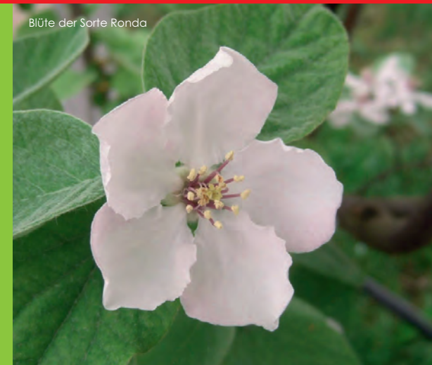
Blüte der Sorte Ronda