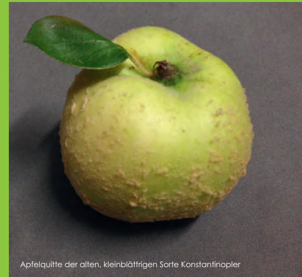
Apfelquitte der alten, kleinblättrigen Sorte Konstantinopler